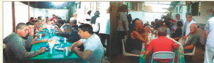
Refeição oferecida pela Casa de Acolhida dos Moradores de Rua.

E se você deseja colaborar conosco entre em contato e abrace esta causa pois daquilo que você pode é o que a nossa obra precisa: Praça São Benedito, 2, Centro Tremembé, Fone: 3672-2667 ou 99772-1688 e um dia escutaremos de Jesus o que ele disse em seu Evangelho: Vinde benditos de meu Pai para o Reino que foi preparado para vós antes que o mundo fosse criado, pois tive fome e me deste de comer, Tive sede e me deste de beber, tive frio e me agasalhaste era peregrino e me acolheste. Mateus 25:31-41 - Em cada pobre que sofre: Cristo se faz presente.