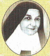
(Coopatrona da Associação Pequena Via)